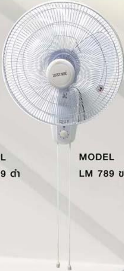
MODEL LM 789 ขาว