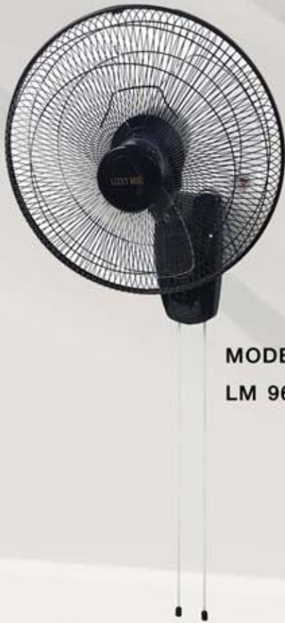
MODEL LM 969 ดำ