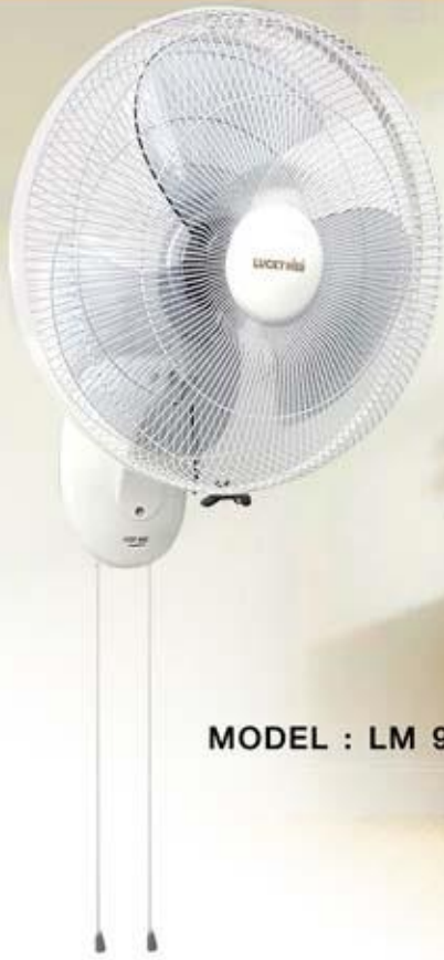
MODEL : LM 989

แขวนสูงได้ ลมไกล 5 เมตร พร้อมระบบปรับสาย-ล็อกสาย