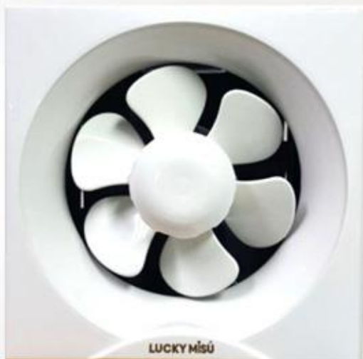
MODEL : F-20SH9-K5