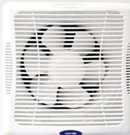
MODEL : VF-8AUT1